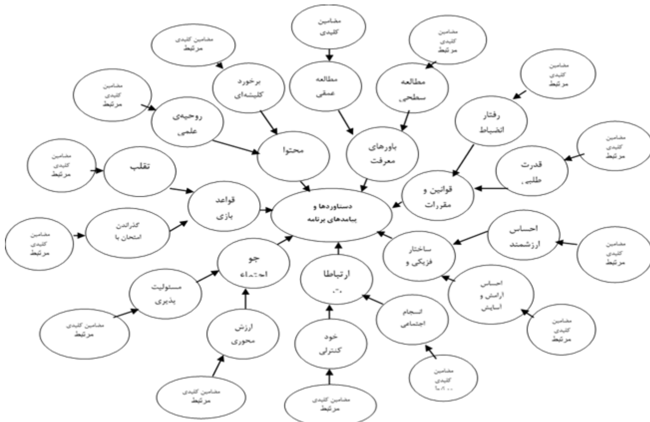
نمودار ۱. شبکه‌ی مضامین دستاوردها و پیامدهای برنامه‌درسی ضمنی دانشگاهی