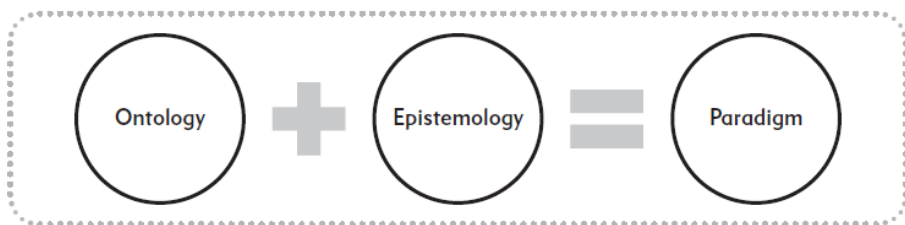
شکل شماره ۱: اجرای پارادایم های پژوهشی (مرادی و میرالماسی، ۲۰۲۰)

محقق در پژوهش حاضر از نقطه نظر هستی شناسی و معرفت شناسی پژوهش را در دسته پارادایم های برساختی و تفسیری قرار می دهد(شکل شماره ۱) و به تبع آن رویکردی کیفی را برای استدلالی استقرایی گونه در جهت حل مسئله بکار می بندد.(شکل شماره ۲).