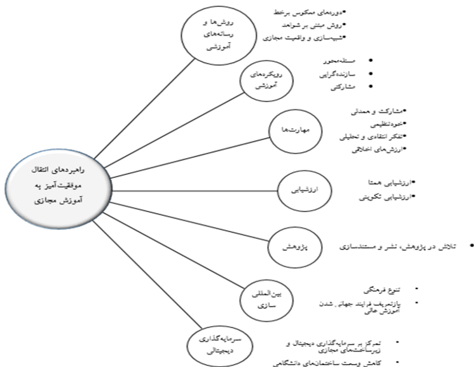
نمودار ۲: چارچوب کلی راهبردهای انتقال موفقیت‌آمیز به آموزش مجازی