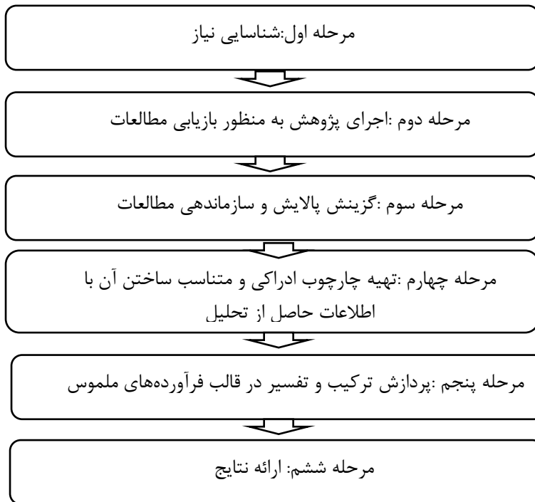
شکل ۱: الگوی شش مرحله ای رابرتس (مارش ۲ ، ۱۳۹۲)

سپس با استفاده از کاربردگر طراحی شده توسط پژوهشگران (پیوست الف)، اطلاعات هر کدام از ۲۴ سند مکتوب، ثبت شد. سپس با استفاده از الگوی شش مرحله-ای سنتز پژوهی رابرتس ۱ (شکل ۱) داده‌ها تحلیل شدند و ویژگی‌های برنامه درسی ریاضی دوره ابتدایی با رویکرد شناختی، استخراج گردید. آنگاه این ویژگی‌ها با ویژگی‌های تبیین شده در پژوهش زادشیر، عصاره، غلام‌آزاد و امام‌جمعه (۱۴۰۱) با هم مقابل شدند که نتیجه آن، طراحی اولیه الگویی برای برنامه درسی ریاضی دوره ابتدایی مبتنی بر رویکرد شناختی بود.