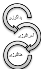
شکل ۱- زنجیره گوژی‌ها

سیر تکوین و شکل‌گیری مفهوم هتاگوژی را باید در ریشه‌های آندراگوژی دانست به‌طوری‌که این رویکرد را می‌توان به‌نوعی بسط و گسترش آندراگوژی قلمداد کرد. زنجیره یادگیری از پداگوژی به آندراگوژی و به هتاگوژی به‌عنوان بخشی از یک فرآیند آموزشی است که در آن مربی/تسهیلگر درحالی‌که توسعه مهارت‌های یادگیری در فراگیرندگان است (شکل زیر):