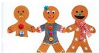
تصویر شماره ۱: دو و نیم!

و نهایتاً مثالی از طنزهای کلامی ارائه شده توسط معلم، بیان حکایت مردی است که به رستوران می رود و در پاسخ به سؤال پیشخدمت که از او می پرسد " پیتزای را به ۴ قسمت تقسیم کند یا ۸ قسمت؟" می گوید " لطفاً ۴ قسمت برش بزنید چون من رژیم دارم!!!"