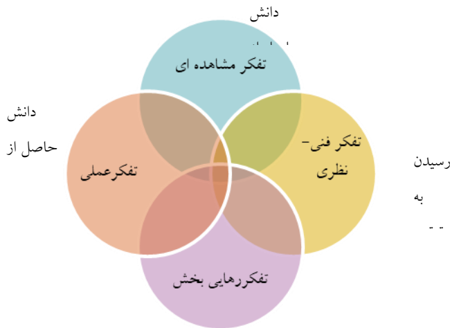
شکل ۱) مدل نظری فرا تفسیری روایت‌نگاری تأملی و توسعه حرفه‌ای

کدام معرف دانش مجزایی است: دانشی که از مشاهده رفتار دیگران کسب می‌شود، دانشی که در موقعیت‌های آموزشی رسمی با اهداف از پیش تعیین شده حاصل می‌شود، دانشی که حاصل به اشتراک‌گذاری با دیگران است و دانشی که با انتقال به موقعیت‌های جدید به دست می‌آید. چهار نوع تفکر مجزا و در عین حال، مرتبط با هم که از این معرفت‌های چهارگانه حمایت می‌کنند عبارتند از: تفکر مشاهده‌ای، تفکر فنی-نظری، تفکر عملی و تفکر رهایی‌بخش.