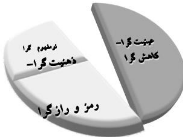
شکل ۱- دو ایده اصلی نظریه‌پردازی که در آن نومفهوم‌گرایی قسمتی از ایده ذهنیت-گرایی - رمز و رازگرایی است.

عصب‌پدیدارشناسی به‌عنوان بستری برای نظریه‌پردازی برنامه‌درسی، فراتر از دو ایده مطرح شده در این مقاله است. ایده‌ عینیت‌گرا- کاهش‌گرا ۲ برای نظریه‌های تبیینی که ساز و کارهای کنترلی ویژگی آن‌هاست (پرکینسون ۳ ، ۱۹۹۳) و ایده مبتنی بر ذهنیت-گرایی- رمز و رازگرایی ۴ که با دیدگاه‌هایی از قبیل پدیدارشناسی و انسان‌گرایی به جای عینیت‌ها و شواهد آزمایشگاهی، به اول شخص و تجربه انسانی توجه دارد یا با تأکید بر مفاهیم موجود در این حوزه نظریه‌پردازی را تلاشی برای فهم برنامه‌درسی به مثابه یک متن می‌داند (شکل ۱).