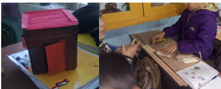
شکل ۹- تلفیق کاردستی و خلاقیت ذهنی (هوش چندگانه)