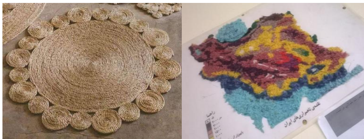
شکل ۸- تلفیق هنر نقاشی با هنر تجسمی: برجسته کاری (به کمک کف و کاموا)