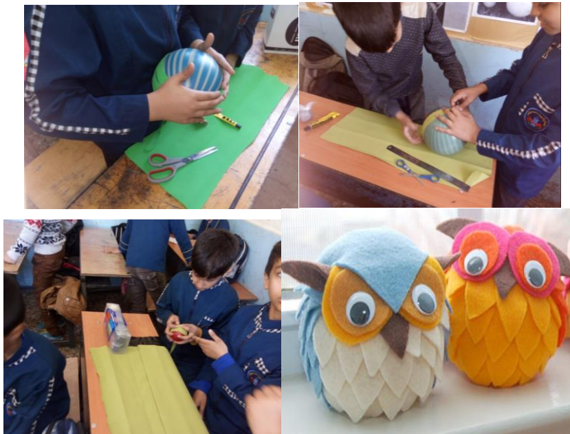
شکل ۳- تلفیق نقاشی با هنر دستی (هنر تجسمی)

شکل ۲- تلفیق داستان سرایی و نمایش همراه با موسیقی خلاقانه دانش آموزان