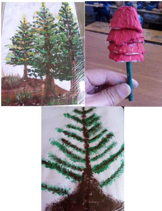
شکل ۵- تلفیق هنر نقاشی پرتابی با هنر گرافیکی یا هنر تجسمی