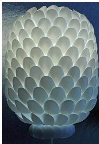
شکل ۱- تلفیق هنر تجسمی و مواد دور ریختنی و ایجاد گل