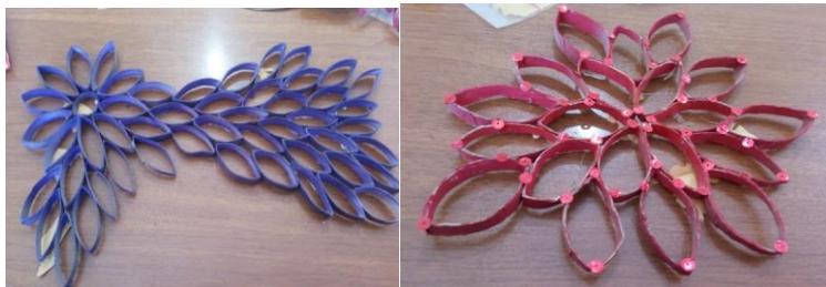
شکل ۷- تلفیق هنر تجسمی با نقاشی همراه با وسایل دور ریختنی