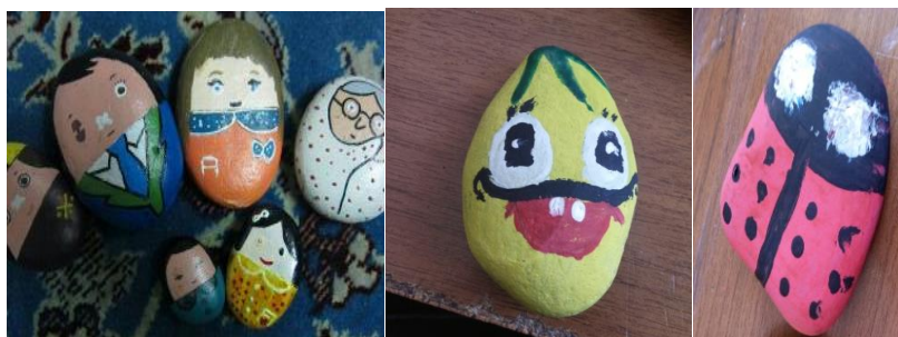
شکل ۴- تلفیق هنر نقاشی با هنرهای بصری تجسمی و تبدیل به شخصیت‌های داستانی