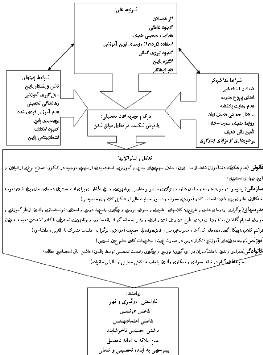
شکل ۲- مدل پارادایمک: افت تحصیلی به‌مثابه پذیرش شکست در مقابل موفق شدن

در مدل پارادایمک پژوهش (شکل ۲)، کنشگران درگیر در افت تحصیلی، این پدیده را به‌مثابه «پذیرش شکست در مقابل موفق شدن» درک و تجربه می‌کنند.