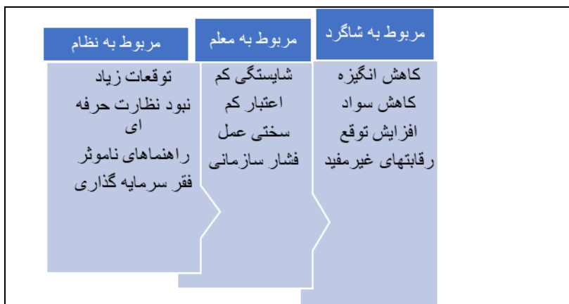
شکل ۲: طبقه‌بندی آسیب‌های ارزشیابی توصیفی دوره ابتدایی از نظر برنامه‌ریزان درسی

در گفتگوهای عمیق با متخصصان برنامه‌ریزی درسی آشکار شد که نظام ارزشیابی توصیفی دوره ابتدایی با دوازده آسیب عمده مواجه است. تلفیق نتایج نشان داد که آسیب‌های طرح ارزشیابی توصیفی دوره ابتدایی در سه طبقه قرار می‌گیرند: آسیب‌های مربوط به نظام آموزش و برنامه درسی، آسیب‌های مربوط به معلم و آسیب‌های مربوط به شاگردان (شکل ۲).