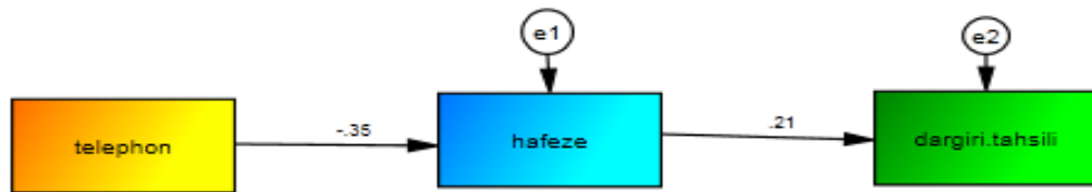
نمودار ۱. ضرایب استاندارد مسیر مدل

برازش خوب الگو با داده‌هاست. شاخص RMSEA برای مدل‌های خوب برابر ۰/۰۵ یا کمتر است. مدل‌هایی که RMSEA آن‌ها ۰/۰۱ باشد، برازش ضعیفی دارند. شاخص GFI که باید برابر یا بزرگ‌تر از ۰/۹۰ باشد، مقدار نسبی واریانس‌ها و کوواریانس‌ها را به گونه مشترک از طریق مدل ارزیابی می‌کند. آزمون مجذور کای (خی دو) این فرضیه را مدل مورد نظر هماهنگ با الگوی هم پراشی بین متغیرهای مشاهده شده است را می‌آزماید، کمیّت خی دو بسیار به حجم نمونه وابسته می‌باشد و نمونه بزرگ کمیّت خی دو را بیش از آنچه که بتوان آن را به غلط بودن مدل نسبت داد، افزایش می‌دهد (هومن، ۱۳۸۷). با توجه به جدول ۱، مقدار RMSEA مدل برابر با ۰/۰۷۸ می‌باشد؛ لذا این مقدار کمتر از ۰/۱ است که نشان‌دهنده این است که میانگین مجذور خطاهای مدل مناسب است و مدل قابل قبول می‌باشد. همچنین مقدار کای دو به درجه آزادی برابر با ۲/۴۶ است که کمتر از ۳ می‌باشد و میزان شاخص CFI، GFI و NFI نیز از ۰/۹ بیشتر می‌باشد که نشان می‌دهند مدل اندازه‌گیری متغیرهای تحقیق، مدل مناسبی است. حال به بررسی سوالات پژوهش فوق می‌پردازیم.