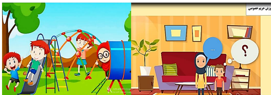
شکل ۲. نمایی از چندرسانه‌ای آموزشی

محتوای تهیه شده ابتدا به صورت متن در اختیار سه محقق حوزه تربیت کودک، قرار داده شد و بعد از دریافت بازخوردها و اصلاح متن به صورت خوانش (گفتار) در آمده و مجدد توسط سه تن از متخصصان حوزه کودک، مورد بازبینی قرار گرفت. در بخش دوم، طراحی آموزشی محتوا به منظور تهیه سناریوی تولید، بخش بندی و مشخص کردن واحدهای تولید صورت گرفت. در بخش سوم، محتوای چندرسانه‌ای تولید شد. در این بخش پس از نهایی شدن متن، به منظور تهیه بسته آموزشی در قالب چندرسانه‌ای، سناریوی تولید تهیه شد. تصاویر و المان‌های تصویری که نشان دهنده مفهوم هر بخش از متن می‌باشد تهیه شده و در قالب نسخه‌ی اولیه در برنامه کمتاسیا ۱ چینش شد. برنامه‌ی تولید شده، توسط تیم تولید متشکل از طراح آموزش، متخصص موضوع، گرافیست و طراح عناصر بصری و تولیدکننده محتوای چندرسانه‌ای، در چهار مرحله مورد بازبینی و اصلاح قرار گرفت و نسخه نهایی آن برای کسب مجوز، اعتباریابی و اجرا در گروه نمونه آماده گردید. پس از کسب مجوز نشر از وزارت فرهنگ و ارشاد اسلامی، محتوا برای انجام فاز بعدی پژوهش در اختیار گروه نمونه قرار گرفت.