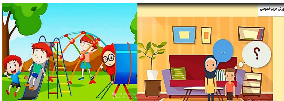
شکل ۲. نمایی از چندرسانه‌ای آموزشی

محتوای تهیه شده ابتدا به صورت متن در اختیار سه محقق حوزه تربیت کودک، قرار داده شد و بعد از دریافت بازخوردها و اصلاح متن به صورت خوانش (گفتار) در آمده و مجدد توسط سه تن از متخصصان حوزه کودک، مورد بازبینی قرار گرفت. در بخش دوم، طراحی آموزشی محتوا به منظور تهیه سناریوی تولید، بخش بندی و مشخص کردن واحدهای تولید صورت گرفت. در بخش سوم، محتوای چندرسانه‌ای تولید شد. در این بخش پس از نهایی شدن متن، به منظور تهیه بسته آموزشی در قالب چندرسانه‌ای، سناریوی تولید تهیه شد. تصاویر و المان‌های تصویری که نشان دهنده مفهوم هر بخش از متن می‌باشد تهیه شده و در قالب نسخه‌ی اولیه در برنامه کمتاسیا ۱ چینش شد. برنامه‌ی تولید شده، توسط تیم تولید متشکل از طراح آموزش، متخصص موضوع، گرافیست و طراح عناصر بصری و تولیدکننده محتوای چندرسانه‌ای، در چهار مرحله مورد بازبینی و اصلاح قرار گرفت و نسخه نهایی آن برای کسب مجوز، اعتباریابی و اجرا در گروه نمونه آماده گردید. پس از کسب مجوز نشر از وزارت فرهنگ و ارشاد اسلامی، محتوا برای انجام فاز بعدی پژوهش در اختیار گروه نمونه قرار گرفت.