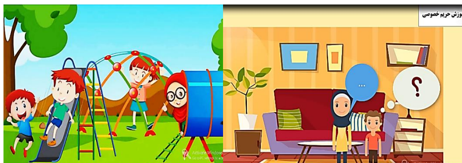
شکل ۲. نمایی از چندرسانه‌ای آموزشی

محتوای تهیه شده ابتدا به صورت متن در اختیار سه محقق حوزه تربیت کودک، قرار داده شد و بعد از دریافت بازخوردها و اصلاح متن به صورت خوانش (گفتار) در آمده و مجدد توسط سه تن از متخصصان حوزه کودک، مورد بازبینی قرار گرفت. در بخش دوم، طراحی آموزشی محتوا به منظور تهیه سناریوی تولید، بخش بندی و مشخص کردن واحدهای تولید صورت گرفت. در بخش سوم، محتوای چندرسانه‌ای تولید شد. در این بخش پس از نهایی شدن متن، به منظور تهیه بسته آموزشی در قالب چندرسانه‌ای، سناریوی تولید تهیه شد. تصاویر و المان‌های تصویری که نشان دهنده مفهوم هر بخش از متن می‌باشد تهیه شده و در قالب نسخه‌ی اولیه در برنامه کمتاسیا ۱ چینش شد. برنامه‌ی تولید شده، توسط تیم تولید متشکل از طراح آموزش، متخصص موضوع، گرافیکست و طراح عناصر بصری و تولیدکننده محتوای چندرسانه‌ای، در چهار مرحله مورد بازبینی و اصلاح قرار گرفت و نسخه نهایی آن برای کسب مجوز، اعتباریابی و اجرا در گروه نمونه آماده گردید. پس از کسب مجوز نشر از وزارت فرهنگ و ارشاد اسلامی، محتوا برای انجام فاز بعدی پژوهش در اختیار گروه نمونه قرار گرفت.