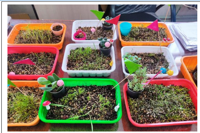
شکل ۱: گلخانه (محل قرار دادن گلدان سبزی‌ها)

هر جلسه از دو بخش تشکیل شده است. بخش اول مرتبط با آموزش و تمرین مهارت‌های مرتبط با توجه پایدار و بخش دوم مرتبط با چالش‌های فردی و گروهی است. در ابتدا مرور تمرینات جلسه قبل انجام می‌شود. سپس پژوهشگر درباره‌ی محتوای جلسه‌ی جدید آموزش‌های لازم را ارائه می‌دهد و دانش‌آموزان در گروه‌های خود به تمرین آن مهارت می‌پردازند. پس از تمرین فردی دانش‌آموزان فعالیت‌های جلسه را به صورت چالش گروهی انجام می‌دهند و با دیگر گروه‌ها رقابت می‌کنند و به کسب امتیاز می‌پردازند. با این شیوه دانش‌آموزان ترغیب می‌شوند تا با دوستانشان در اجرای مهارت‌ها تعامل کنند.