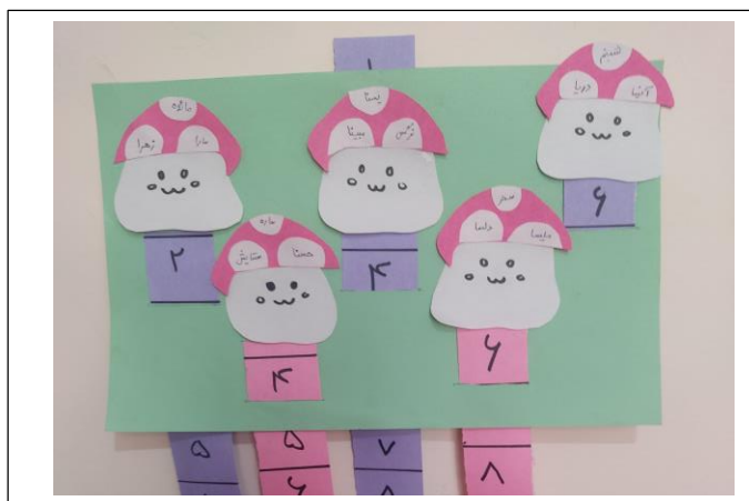
شکل ۳: تابلو امتیازات

تکالیف هر جلسه در انتهای کلاس ارائه می‌شود. کودک به تعداد دفعات فرصت کوشش و خطا دارد و به این منظور قبل از شروع جلسات، گروهی مجازی برای هر دو گروه کنترل و آزمایش تشکیل داده شد. در گروه مجازی آزمایش به تکالیف دانش‌آموزان بازخورد داده می‌شد، امتیازات آنان در اطلاع عموم قرار می‌گرفت و نفرات برتر هر جلسه در گروه معرفی می‌شدند. گروه مجازی تشکیل شده برای گروه کنترل تنها جهت اطلاع‌رسانی برنامه کلاسی و قرار دادن تکالیف کلاسی تشکیل شد و هیچ گونه برنامه‌ی بازی‌وارسازی شده‌ای در آن اجرا نگردید.