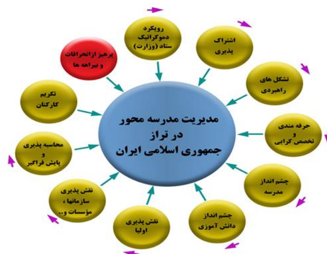
شکل ۲. مهندسی استقرار مضامین سازمان دهنده در شبکه مضامین

مدل پیشنهادی مدیریت مدرسه محور در تراز جمهوری اسلامی ایران چیست؟