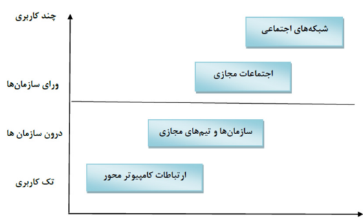
شکل ۱. سطوح مجاز در فضای مجازی (پانتیل ۲۰۰۹)

پانتیل (۲۰۰۹) در زمینه شبکه‌های مجازی اجتماعی، چهار سطح از مجاز در دنیای دیجیتال را مورد بررسی قرار می‌دهد و معتقد است که شبکه‌های اجتماعی مجازی در بالاترین سطح از مجاز قرار دارند. (شکل ۱)