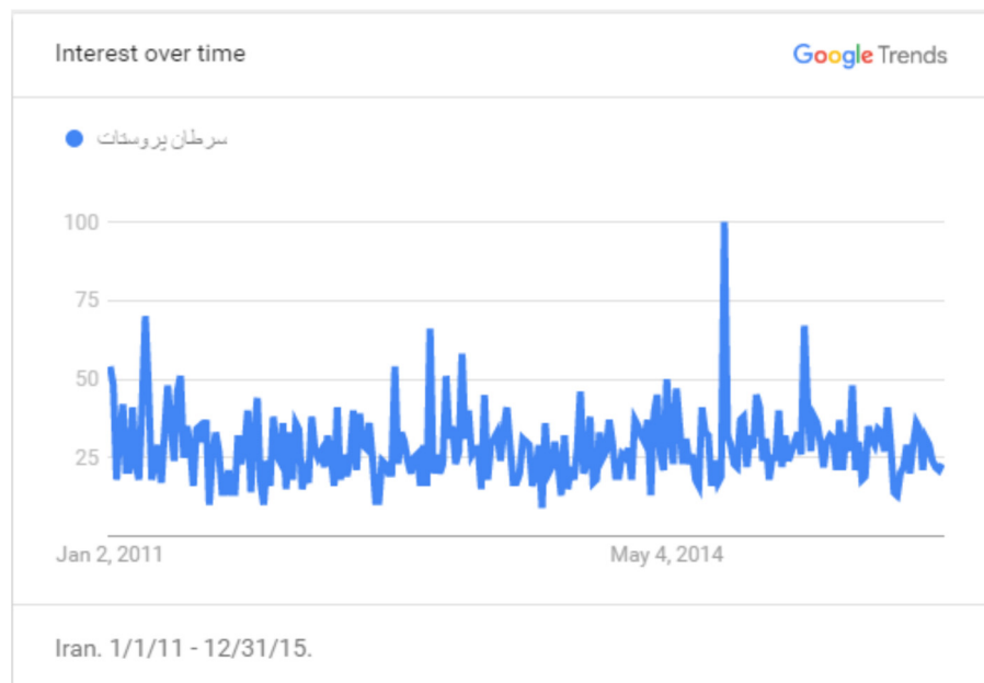
نمودار ۱. شاخص حجم جستجوی کلیدواژه «سرطان پروستات»

در نمودار (۲)، شاخص حجم جستجوی کلیدواژه « prostate cancer » در دوره زمانی یک ژانویه ۲۰۱۱ تا سی و یک دسامبر ۲۰۱۵ میلادی به تصویر کشیده شده است. طبق نمودار، یافته‌های حاصل از گوگل ترندز در این کلیدواژه نشان می‌دهد حجم جستجوی کاربران در موتور جستجوی گوگل بین سال‌های ۲۰۱۱ تا ۲۰۱۵ میلادی شیب نزولی داشته است.