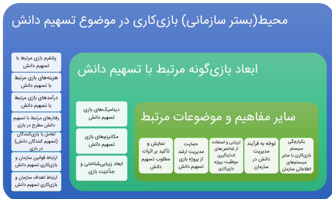
شکل ۴ - مدل‌سازی بصری یافته‌های پژوهش

دلفی برای طیف گسترده‌ای از سؤالات پیچیده، و در طیف وسیعی از زمینه‌ها استفاده می‌شود. در این روش، نظرات نخبگان مورد توجه است. به طور کلی روش دلفی، شامل چندمرحله اساسی است (اوکولی و پاولوسکی، ۲۰۰۴). در مرحله اول، مسئله پژوهش تعریف می‌شود و براساس آن ویژگی‌های لازم برای شرکت‌کنندگان در پانل دلفی تعیین می‌گردد. سپس نامزدهای مشارکت در این پانل شناسایی و از آنان دعوت به عمل می‌آید. در مرحله دوم روش دلفی، پژوهشگر، عواملی را از پیش تعیین و آن‌ها را برای نظرخواهی در اختیار اعضا قرار دهد. در مرحله سوم، اعضا میزان اهمیت عوامل را تعیین کرده و تعدادی از مهم‌ترین آن‌ها را انتخاب می‌کنند. مرحله چهارم به بازنگری در میزان اهمیت عوامل براساس نتایج قبلی اختصاص دارد (علیدوستی ۱۳۸۵). انتخاب اعضای مناسب برای پانل دلفی از مهم‌ترین مراحل روش به حساب می‌آید؛ چرا که اعتبار نتایج کار بستگی زیادی به شایستگی و دانش این افراد دارد (پاول، ۲۰۰۳). جهت استفاده از روش دلفی، محققان با ۴ تن از اساتید دانشگاه که در زمینه مدیریت دانش متخصص بوده و با مفاهیم بازی‌کاری نیز آشنا بودند، مصاحبه‌ای نیمه‌ساختار یافته داشته و ضمن تشریح مراحل روش نظریه‌پردازی داده‌بنیاد، ارائه یافته‌ها و مدل‌های بصری، درخصوص ارزیابی نظریه از ایشان نظرخواهی نمودند. پس از دریافت نظرات خبرگان، پیشنهادات مشترک و مطلوب از حیث جامع بودن و ارتباط با موضوع، جمع‌بندی شد.