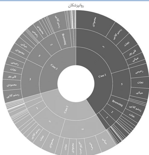
نمودار ۳: زمان سپری شده توسط درمانگران روانپزشک نمونه در مراحل مختلف کولثاو