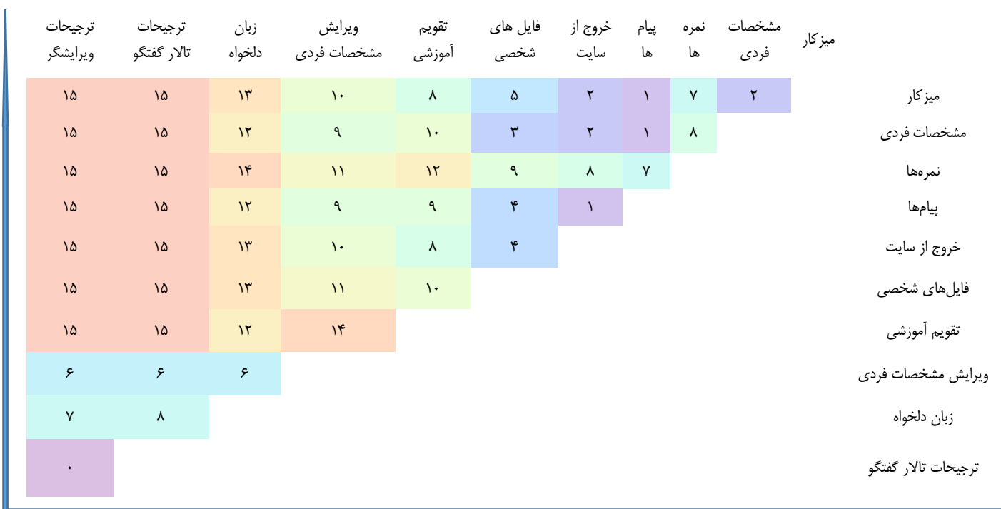
نمودار ۱. بخشی از نمودار ماتریس فاصله کارت‌ها

و همچنین در ادامه، قسمتی از یافته‌های ماتریس فاصله نشان داده شده است، اعداد نمودار نشانگر اختلاف بین کارت‌ها در هر جفت است. هرچه عدد پایین‌تر باشد، دو کارت شباهت بیشتری دارند و هرچه تعداد آن بیشتر باشد، مقادیر متفاوت‌تر هستند، بنابراین همان گونه که مشاهده می‌شود به عنوان مثال «ترجیحات گفتگو» با «ترجیحات ویرایشگر» بیشترین شباهت را دارند و در عین حال «ترجیحات گفتگو» با «میزکار» بیشترین میزان تفاوت را از نظر شرکت‌کنندگان پژوهش داشته‌اند.