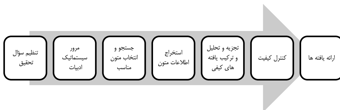
شکل ۱. هفت گام فراترکیب (سندلوسکی و باروسو، ۲۰۰۷)

در مرحله‌ی اول یعنی گردآوری داده‌های کیفی پژوهش که هدف آن تدوین الگو است از روش فراترکیب استفاده نمود. به منظور تحقق هدف تحقیق، از روش هفت مرحله‌ای سندلوسکی و باروسو ۱ (۲۰۰۷) استفاده شد. در مرحله‌ی دوم، به صحنه‌گذاری و اعتبارسنجی الگو ارائه شده با استفاده از نظر خبرگان کسب و کارهای اینترنتی شامل مدیران و کارشناسان خبره در حوزه‌ی شبکه‌های اجتماعی در شرکت‌ها و در بخش ارتباط با مشتریان،