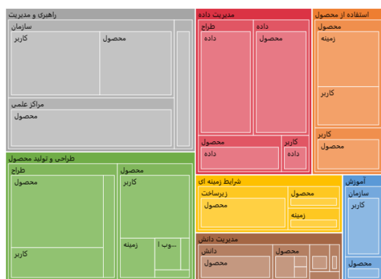
شکل ۲. هم‌پیوندهای همزیستی انسان-فناوری معنایی، به همراه عاملیت‌ها

شکل، همچنین عاملیت‌های موجود در هر هم‌پیوند را نشان می‌دهد. تفسیر این هم‌پیوندها، یک دید فرآیندی از همزیستی انسان-فناوری معنایی در اختیار ما می‌گذارد.