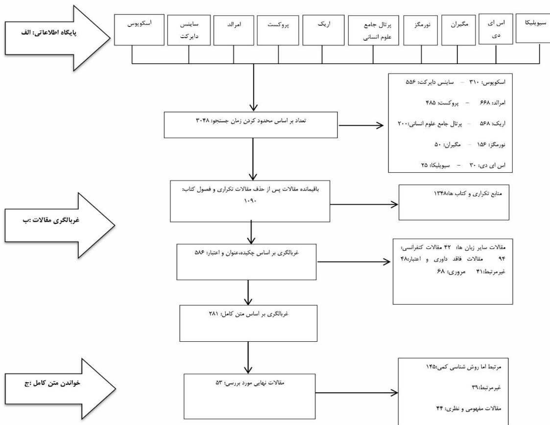
شکل ۲. الگوریتم انتخاب مقالات

در این مرحله برای بررسی مقاله ها ۲ معیار در نظر گرفته شد: الف) تاریخ طرح موضوع: مقاله ها از سال ۱۹۹۱ تا سال ۲۰۲۱ میلادی برای پژوهش های خارجی و ۱۳۷۱ تا ۱۴۰۰ هجری شمسی برای پژوهش های خارجی در نظر گرفته شد. ب) اعتبار منابع: در این پژوهش با توجه به اینکه مقاله ها پژوهشی تحت نظارت و داوری های معتبر و خاصی قرار می گیرند و دسترسی به سایر منابع از جمله پایان نامه های لاتین