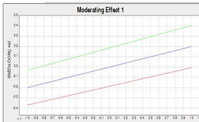
شکل ۳. نمودار اثر تعدیلگر انسان‌انگاری بر خلق ارزش مشترک