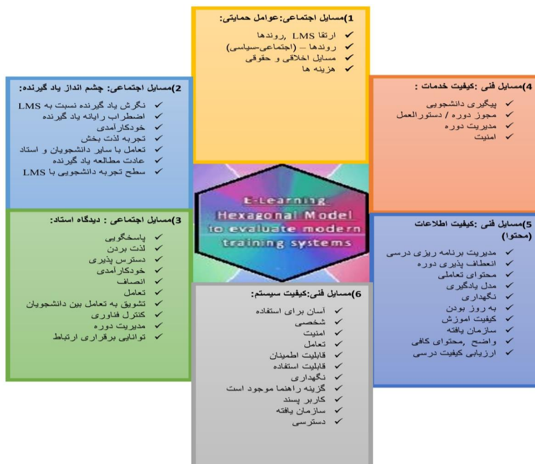
شکل (۱). مدل مفهومی آموزش الکترونیکی شش ضلعی هلام (اوزکان، ۲۰۰۹)

سایر دانش‌آموزان و معلم، عادت مطالعه یادگیرنده، سطح تجربه دانشجویی با آلام اس)، ۵. نگرش استاد (پاسخگویی، لذت بردن، اطلاعاتی بودن، خودکارآمدی، انصاف، تعامل، تشویق به تعامل بین دانشجویان، کنترل فناوری، مدیریت دوره، توانایی برقراری ارتباط)، ۶. مسائل حمایتی (ارتقای آلام اس، روندها (اجتماعی-سیاسی)، مسائل اخلاقی و حقوقی، هزینه‌ها) (اوزکان و کوسه‌لر ۸ ، ۲۰۰۹).