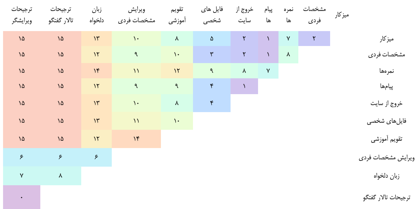
نمودار ۱. بخشی از نمودار ماتریس فاصله کارت‌ها

و همچنین در ادامه، قسمتی از یافته‌های ماتریس فاصله نشان داده شده است، اعداد نمودار نشانگر اختلاف بین کارت‌ها در هر جفت است. هرچه عدد پایین‌تر باشد، دو کارت شباهت بیشتری دارند و هرچه تعداد آن بیشتر باشد، مقادیر متفاوت‌تر هستند، بنابراین همان