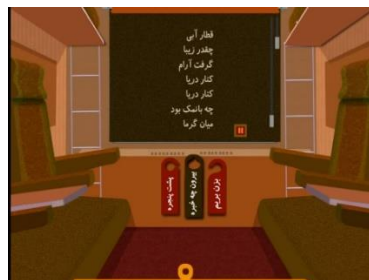
شکل ۴. صفحه اصلی کتاب قطار آبی: دریا

شعرها و تصاویر نسخه تعاملی و نسخه چاپی مجموعه قطار آبی یکی هستند اما کتاب برای نسخه تعاملی بازنویسی شده است. پرده پنجره در قطار هات اسپات است. با ضربه زدن روی آن پرده روی پنجره کشیده می‌شود و متن شعر روی آن ظاهر می‌شود. براساس انتخاب پیشین خواننده، این متن را یا راوی یا خودش خواهد خواند. سه هات اسپات دیگر نیز در نظر گرفته شده‌اند (شکل ۴): بزن بریم (با ضربه‌زدن روی آن قطار حرکت می‌کند)، بیرون چه خبره (متناسب با کتاب تصاویری متحرک از کوه، جنگل یا دریا نشان داده می‌شود. در این بخش جلوه‌های صوتی و هات اسپات‌های جدیدی در نظر گرفته شده است) و پشت پنجره (با انتخاب این مورد تصویری بزرگ‌نمایی شده از منظره پشت پنجره نمایش داده می‌شود).