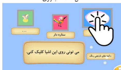
شکل ۱۱. آموزش نقاط هات اسپات

راهنماهای مناسب برای حرکت در صفحات کتاب در نظر گرفته شده است. در برخی از کتاب‌ها جورچینی از شخصیت‌ها یا صفحات کتاب برای بازی خواننده در نظر گرفته شده است. این جورچین در روند داستان تأثیری ندارد و فقط جنبه سرگرمی برای خواننده دارد و نمی‌توان آن را یک کتاب‌بازی در نظر گرفت.