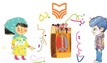
شکل ۱۰. انتخاب راوی

شخصیت‌ها صحبت می‌کنند. در سه کتاب: دست بزنم به کبریت، دست بزنم به چاقو و دست بزنم به قلیون خواننده می‌تواند تعیین کند شعر با صدای دخترانه یا صدای پسرانه خوانده شود (شکل ۱۰). در همین سه کتاب پیش از وارد شدن به برنامه به خواننده آموزش داده می‌شود که نقاط قابل لمس و ضربه‌زدن (هات اسپات‌ها) در صفحه از نظر ظاهری چه ویژگی‌هایی دارند (شکل ۱۱). در سایر کتاب‌های تعاملی این ناشر قسمت‌های هات اسپات مشخص نبودند و بر حسب اتفاق مورد شناسایی قرار می‌گرفتند.