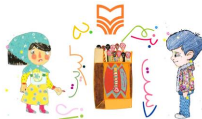
شکل ۱۰. انتخاب راوی

شخصیت‌ها صحبت می‌کنند. در سه کتاب: دست بزنم به کبریت، دست بزنم به چاقو و دست بزنم به قلیون خواننده می‌تواند تعیین کند شعر با صدای دخترانه یا صدای پسرانه خوانده شود (شکل ۱۰). در همین سه کتاب پیش از وارد شدن به برنامه به خواننده آموزش داده می‌شود که نقاط قابل لمس و ضربه‌زدن (هات اسپات‌ها) در صفحه از نظر ظاهری چه ویژگی‌هایی دارند (شکل ۱۱). در سایر کتاب‌های تعاملی این ناشر قسمت‌های هات اسپات مشخص نبودند و بر حسب اتفاق مورد شناسایی قرار می‌گرفتند.