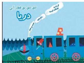
شکل ۵. صفحه اول کتاب قطار آبی: دریا

در این مجموعه نیز برای شروع خواننده باید بتواند کلمات را بخواند (شکل ۵). مخاطب با ضربه‌زدن روی تصاویری که هات اسپات هستند (یا در مواردی کشیدن) آن‌ها را به حرکت می‌آورد یا ظاهرشان را تغییر می‌دهد