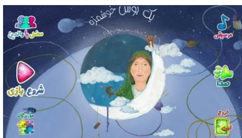
شکل ۸. صفحه اول کتاب یک بوس خوشمزه از مجموعه شوتک