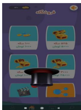
شکل ۶ پرداخت درون‌برنامه‌ای