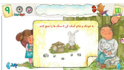
شکل ۹. نمونه تعامل در کتاب بگذار فکر کنم از مجموعه شوتک

ویژگی‌های تعاملی داستان هیولای خندان این داستان در گونه ادبیات الکترونیک و با روایتی تعاملی خلق شده است. خواننده داستان همزمان با شنیدن روایت می‌تواند تغییراتی روی تصاویر ایجاد کند. مثلاً در قسمتی از داستان که با خنده هیولاها همه جا سبز و رنگی می‌شود، خواننده با ضربه‌زدن بر روی صفحه می‌تواند تصاویر را رنگی کند. روایت داستان خطی و پایان آن بسته است و پیوندهای فرامتنی وجود ندارد.