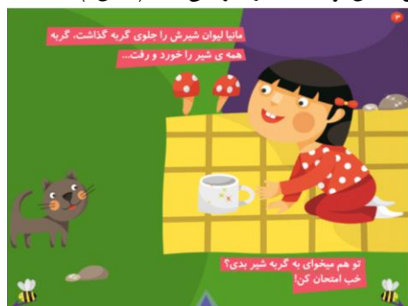
شکل ۳. پرسش از خواننده برای تعامل

محتوای نسخه چاپی کتاب داستانی مانیا برای کتاب تعاملی بازنویسی و مناسب‌سازی شده است و به همین دلیل متن نسخه کتاب تعاملی نسبت به نسخه چاپی تفاوت‌هایی دارد. در نسخه چاپی برای خواننده نیز نقشی در نظر گرفته شده و روایت داستان تعاملی شده است. به عنوان نمونه در کتاب روزی که مانیا مهربان شد علاوه بر متن نسخه چاپی در کتاب تعاملی پرسشی اضافه شده است تا تصمیم‌گیری و انتخاب خواننده در مسیر داستان تعاملی او با کتاب را افزایش دهد (شکل ۳).