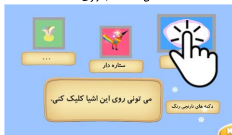
شکل ۱۱. آموزش نقاط هات اسپات

راهنماهای مناسب برای حرکت در صفحات کتاب در نظر گرفته شده است. در برخی از کتاب‌ها جورچینی از شخصیت‌ها یا صفحات کتاب برای بازی خواننده در نظر گرفته شده است. این جورچین در روند داستان تأثیری ندارد و فقط جنبه سرگرمی برای خواننده دارد و نمی‌توان آن را یک کتاب‌بازی در نظر گرفت.