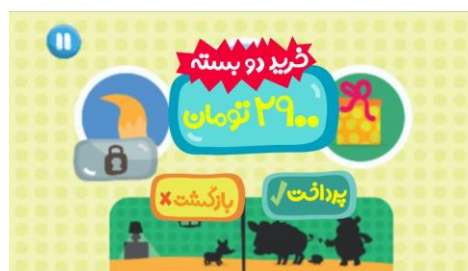
شکل ۲. پرداخت هزینه برای خرید بسته

چند بازی متناسب با داستان طراحی شده است. به عنوان نمونه: جورچین و وصل کردن اشیاء مشابه به هم. کودک برای انجام این بازی‌ها یا دیگر عکس‌العمل‌هایی که متناسب با صحبت راوی باید انجام دهد می‌تواند از ضربه زدن روی صفحه یا کشیدن استفاده کند.