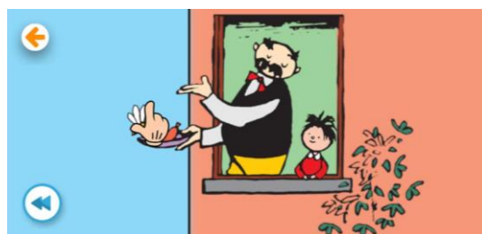
شکل ۷. تامل مخاطب با داستان