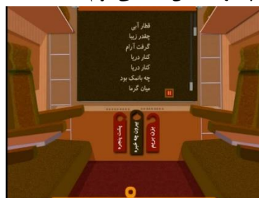
شکل ۴. صفحه اصلی کتاب قطار آبی: دریا

شعرها و تصاویر نسخه تعاملی و نسخه چاپی مجموعه قطار آبی یکی هستند اما کتاب برای نسخه تعاملی بازنویسی شده است. پرده پنجره در قطار هات اسپات است. با ضربه زدن روی آن پرده روی پنجره کشیده می‌شود و متن شعر روی آن ظاهر می‌شود. براساس انتخاب پیشین خواننده، این متن را یا راوی یا خودش خواهد خواند. سه هات اسپات دیگر نیز در نظر گرفته شده‌اند (شکل ۴): بز بزم (با ضربه‌زدن روی آن قطار حرکت می‌کند)، بیرون چه خبره (متناسب با کتاب تصاویری متحرک از کوه، جنگل یا دریا نشان داده می‌شود. در این بخش جلوه‌های صوتی و هات اسپات‌های جدیدی در نظر گرفته شده است) و پشت پنجره (با انتخاب این مورد تصویری بزرگ‌نمایی شده از منظره پشت پنجره نمایش داده می‌شود).