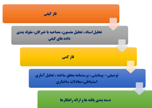
شکل (۱) مراحل روش‌شناسی پژوهش