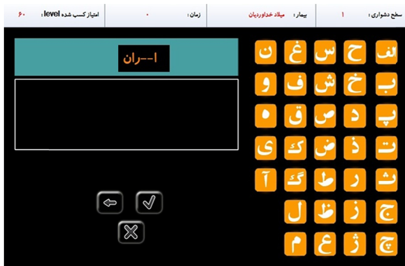
تصویر ۱- نمونه‌ای از تمرینات جهت تقویت حافظه آینده‌نگر

سطح (ب) عدم تشویق حدس زدن و استفاده از روش آزمایش و خطا (ج) ندادن فرصت اشتباه به فرد با دادن سرخ‌های بیشتر برای بازیابی تا رسیدن به پاسخ درست (د) ارائه نمونه و مثال‌های کافی قبل از اینکه از فرد خواسته شود تکلیف اصلی را انجام دهد (و) تصحیح فوری خطاها.