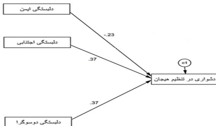
جدول ۷: شاخص‌های برازش مدل