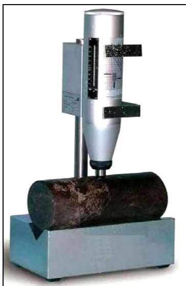
شکل ۱. نحوه استفاده از چکش اشمیت

عدد بازگشتی را می‌توان با منحنی کالیبره موجود بر روی چکش به مقاومت فشاری سنگ ارتباط داد. منحنی کالیبره برای مقاومت فشاری در این روش دارای حساسیت بسیار زیادی است و تحت تأثیر عوامل متعددی از جمله نوع سنگ، وزن واحد حجم، میزان تخلخل، درصد رطوبت، درجه هوازگی و امتداد قرارگیری چکش نسبت به سطح سنگ به‌هنگام انجام آزمایش و استفاده از چکش اشمیت است [۱].