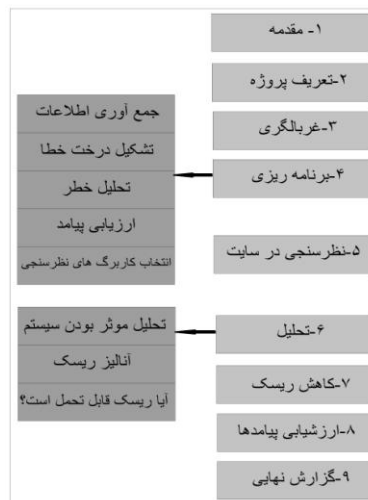
شکل ۳. فرآیند ارزیابی ریسک در سدها به روش RAM-D [۱۳]

روش RAM-D از روش تحلیل درخت خطا بهره می‌گیرد و اطلاعات مورد نیاز را از متخصصان، منابع موجود و سایت‌های اینترنتی فراهم می‌کند و طرح و نقشه اولیه سدها به شدت بستگی به این موارد دارد. RAM-D فرآیند زنده و پویا است که با تغییر محیط تهدید نیاز به بازبینی و تغییر دارد [۱۳]. در شکل ۳ مراحل اجرای ارزیابی ریسک به روش RAM-D نشان داده شده است.