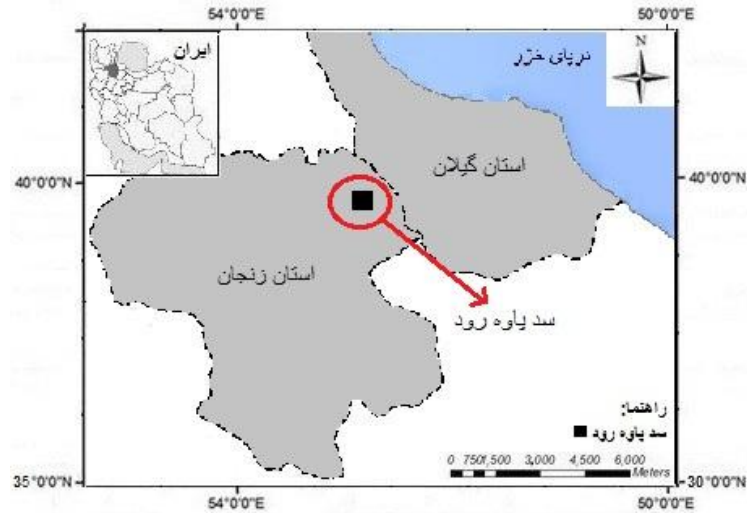
شکل ۱. موقیت مکانی سد پاورود زنجان