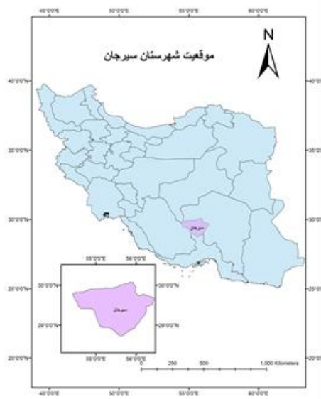
شکل ۱. موقعیت شهرستان سیرجان روی نقشه