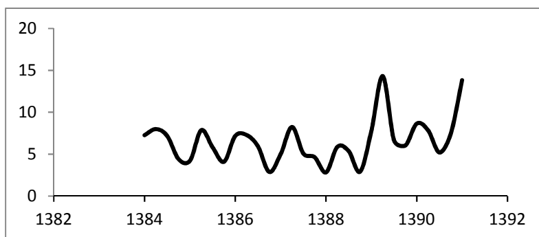
نمودار ۲. روند شاخص عدم تطبیق مهارت برای کل کشور از بهار سال ۱۳۸۴ تا بهار سال ۱۳۹۱ منبع: عیسی‌زاده و نائینی (۱۳۹۵)

مطالعه حاضر به بررسی دقیقتر وضعیت فعلی بازار کار کشور از نظر عرضه و تقاضای مهارت می‌پردازد؛ در این راستا و به منظور کمی کردن مسئله عدم تطبیق مهارت، از اطلاعات موجود در طرح آمارگیری نیروی کار از سال ۱۳۸۴ تا سال ۱۳۹۱ استفاده شده است. روند عدم تطبیق مهارت از بهار سال ۱۳۸۴ تا بهار سال ۱۳۹۱ برای کل کشور در نمودار زیر نشان داده شده است. همانگونه که ملاحظه می‌گردد، عدم تطبیق مهارت از مقدار ۷/۲۷ در بهار سال ۱۳۸۴ به میزان ۱۳/۸۳ در بهار سال ۱۳۹۱ افزایش یافته است.