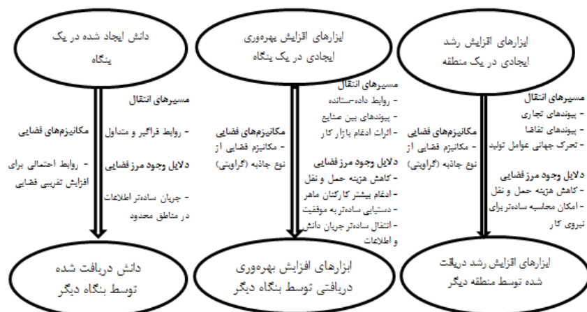
شکل (۱). عوامل مؤثر بر سرریزهای دانش، بهره‌وری و رشد اقتصادی

همکاران ۱ (۲۰۱۲) در شکل شماره ۱ خلاصه شده است. مطابق این فرایند، انتقال دانش ناشی از سرریزهای منطقه‌ای، از طریق روابط بین سرمایه‌گذاران محلی با سرمایه‌گذاران وارد شده از مناطق دیگر، صورت می‌گیرد. انتقال فناوری نیز نه تنها بر اساس پیوند بین صنایع، بلکه از طریق روابط داده-ستانده و اثرات ادغام بازار رخ خواهد داد. در نهایت، با افزوده شدن پیوندهای تجاری و تحرک در عوامل تولید، افزایش در رشد اقتصادی منطقه میسر خواهد شد. مدل و متغیرهای تحقیق حاضر، بر مبنای نظریه جغرافیای اقتصادی جدید انتخاب می‌شود.