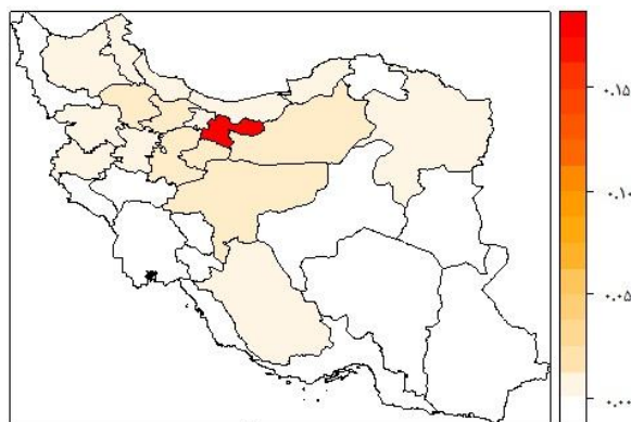
نقشه (۱). اثرات سرریز سرمایه‌گذاری صنعتی استان تهران بر سایر استان‌های کشور

ضریب اثرگذاری غیرمستقیم (اثرات سرریز) هر یک از متغیرها، را می‌توان برای هر یک از استان‌ها به صورت مجزا بدست آورد. تفکیک استانی این اثرات، دید بهتری از اثرات سرریز به برنامه‌ریزان و سیاست‌گذاران ملی می‌دهد. در این بخش، تنها اثرات سرریز سرمایه‌گذاری صنعتی که مورد هدف این تحقیق می‌باشد بطورخاص و جزئی به تفکیک هریک از استان‌ها بیان می‌شود. بررسی این اثرات به تفکیک هر استان نشان می‌دهد که بیشترین اثرات سرریز سرمایه‌گذاری صنعتی، مربوط به استان تهران است. اثرات سرریز سرمایه‌گذاری صنعتی این استان بر سایر استان‌ها به عنوان نمونه، در نقشه شماره ۱ آمده است.