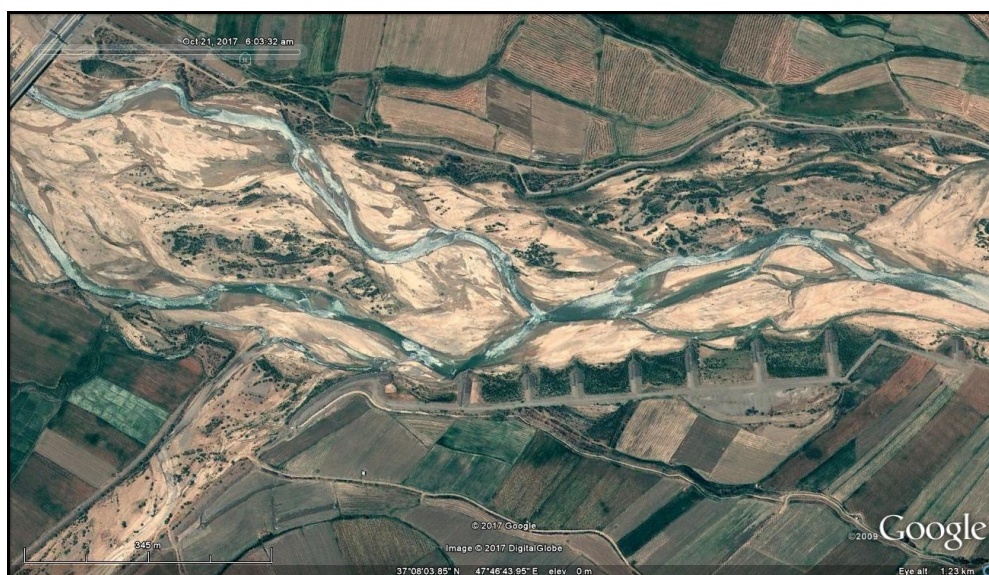
شکل (۲). فرم شریانی رودخانه قزل اوزن در ترانسکت شماره ۱۳

با توجه به جدول (۱) بیشتر مسیر رودخانه قزل اوزن در بازه مورد مطالعه از الگوی سینوسی تبعیت می کند به طوری که از ۲۴ ترانسکت، تعداد ۱۵ ترانسکت الگوی سینوسی دارد. البته در برخی از بخش های مسیر رودخانه، گرایش به الگوی مستقیم نیز دیده می شود که تعداد ۶ ترانسکت از این الگو تبعیت می کند. گرایش به الگوی مئاندری در این بازه از مسیر رودخانه کم و تنها در ۳ ترانسکت دیده می شوند. رودخانه قزل اوزن در بازه مورد مطالعه، به جهت مورفولوژی محیط اطراف مجرای رودخانه، وضعیت همگنی ندارد. در حالت کلی می توان ۲ تیپ شاخص را در این ارتباط مورد شناسایی قرار داد. تیپ اول فرم کوهستانی است که بیشتر مسیر رودخانه در این فرم جریان دارد. در این بخش ها، رودخانه غالباً در معبری تنگ و باریک طی مسیر می کند و یال های دامنه در سواحل راست و چپ رودخانه با شیب تند به مجرا ختم می شود. تیپ دوم، فرم دشت سیلابی است که بخش کمتری از رود در آن جاری است. در این مناطق به جهت پهن تر شدن مجرا، کاهش شیب دامنه ها و وجود زمین های قابل کشت، سواحل اطراف به زیر کشت رفته اند و مناطق مسکونی شکل گرفته اند. از نظر شکل ظاهری رودخانه قزل اوزن در این قسمت، حالت شریانی دارد؛ زیرا پتانسیل حمل رسوبات آن بالا بوده و برای اتلاف انرژی مازاد، جریان در آن تمایل به گستردگی دارد. از این رو تهنشست مواد رسوبی کف به میزان فراوان صورت می یابد شکل (۲).