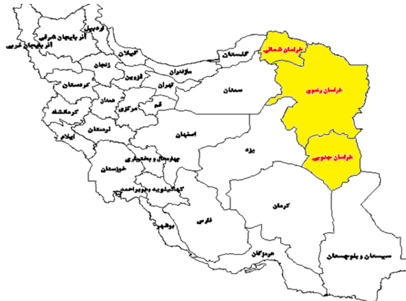
شکل (۱). موقعیت قرارگیری منطقه خراسان (سه استان خراسان شمالی، خراسان رضوی و خراسان جنوبی) در سطح کشور