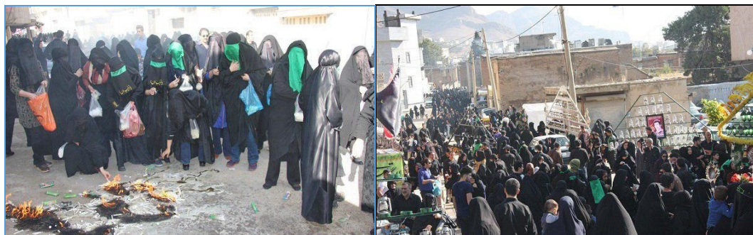
شکل(۱): افراد حاضر در مراسم چهل منبر شهرستان خرم‌آباد روز تاسوعای سال ۱۳۹۷