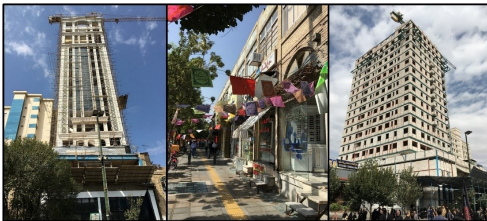
شکل (۳). جداره قدیمی و جداره جدید خیابان امام رضا (ع)

پس نباید هویت یک شهر و یا کشور را برای کسب ارزش افزوده و سود عده‌ای قلیل برای سال‌های متمادی، نامتقارن و ناهماهنگ با حرم مطهر و فرهنگ ایرانی نمود. خیابان امام رضا(ع) در اتصال با حرم مطهر است و تنها سه خیابان دیگر (شیرازی، طبرسی و نواب صفوی) با این نقش وجود دارند. البته عرض خیابان امام رضا(ع) در وضعیت کنونی از سه خیابان مذکور بیشتر است. با مقایسه گذشته و امروز خیابان امام رضا(ع) تفاوت جداره‌ها به وضوح مشخص می‌شود. امروز به جای آنکه مردم شاهد توجه مدیران شهری به چنین نمونه‌هایی و حفاظت و حراست از آن‌ها و نیز تکرار آن سیاست‌ها در دیگر نقاط شهر باشند، شاهد از بین رفتن این آثار و به وجود آمدن ساختمان‌های مرتفع در نزدیکی حرم مطهر هستند. بدون هیچ‌گونه ضابطه و قانونی و بدون توجه به جداره‌های طراحی شده چهار دهه پیش، هر طور که مالکان و صاحبان املاک مایل باشند، می‌توانند ساخت و ساز و یا مرمت کنند. در شکل (۳) جداره چهار دهه پیش با خط آسمان هماهنگ ملاحظه می‌گردد. اما امروز هتل‌هایی با ارتفاع، ابعاد، اندازه و نمای متفاوت شکل گرفته‌اند و یا در حال شکل‌گیری هستند.