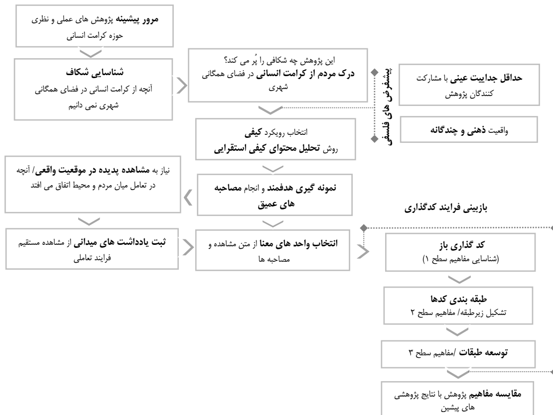
شکل (۱). فرآیند پژوهش

از میان مطالعات انجام شده در این حوزه می‌توان به مطالعه‌ی کااو ۲۰۱۹، اشاره کرد که به روابط اجتماعی و الگوهای استفاده از فضاهای همگانی شهری در انگلستان و چین اشاره کرد که به تجزیه و تحلیل الگوهای استفاده از فضای همگانی و انواع روابط اجتماعی می‌پردازد. داده‌های مشاهده شده‌ی این مطالعه از چهار فضای عمومی واقع در شزو چین و شفیلد انگلستان استخراج شده و ویژگی‌های شخصی کاربران، فعالیت‌های آن‌ها و نحوه اشغال فضای همگانی را مورد تحلیل قرار داده است. نتایج این مطالعه به اهمیت فضاهای همگانی برای انواع کاربران و نحوه‌ی استفاده از آن فضا و گروه‌های مختلف اجتماعی می‌پردازد. مطالعه دراوکوف ۲۰۱۹، به بازنگری مفهوم کرامت انسانی در عصر جدید می‌پردازد. در این مطالعه عزت نفس را یکی از مفاهیمی می‌داند که در چند دهه گذشته به طور چشمگیری تغییر کرده است. این مطالعه تلاش می‌کند که این مفهوم را از مخاطرات فناوری‌های جدید و امکان تهدید شأن انسانی مورد توجه قرار دهد.