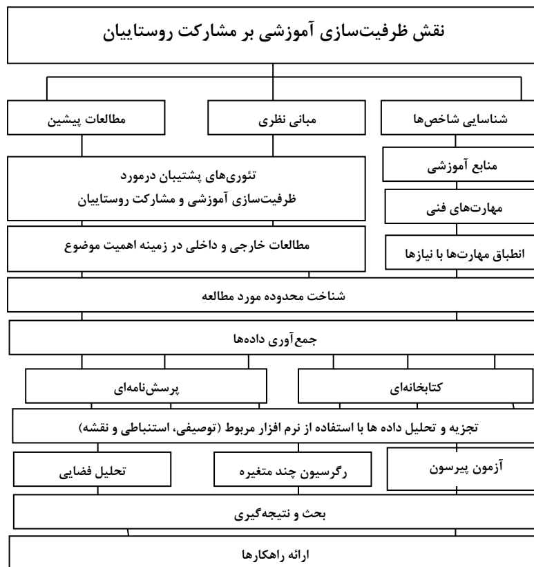
شکل (۳). فرآیند انجام پژوهش؛ ترسیم از نگارندگان

استفاده از نرم افزار SPSS، مورد تجزیه و تحلیل قرار گرفت. در نهایت با استفاده از نرم افزار ARC GIS اقدام به ترسیم نقشه و تحلیل فضایی روستاها از نظر میزان برخورداری از شاخص-های ظرفیت سازی آموزشی نموده است.