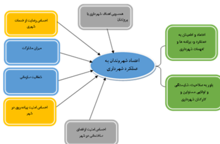
شکل (۱). مدل مفهومی تحقیق مبنی بر عوامل مؤثر بر میزان اعتماد شهروندان به عملکرد شهرداری ساری

این تحقیق، با ترکیب نظریه‌های گیدنز، زتومکا، پاتنام، فوکویاما و پیشینه تجربی تحقیق، عوامل مؤثر بر میزان اعتماد شهروندان به عملکرد شهرداری ساری بر اساس شش مؤلفه همسویی اهداف شهرداری با نیازهای شهروندان، احساس رضایت از خدمات شهری، میزان مشارکت، شفافیت سازمانی، احساس امنیت پیاده‌روی در شهر و احساس امنیت از فضای ساختمانی در شهر بررسی شده است. این شش مؤلفه به صورت مدل تحلیلی در شکل (۱) نشان داده شده‌اند.