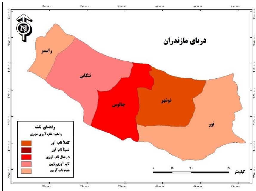
شکل (۲). نقشه شهرهای ساحلی غرب استان مازندران بر اساس وضعیت تاب‌آوری شهری

مقایسه شهرهای ساحلی غرب استان مازندران بر اساس وضعیت تاب‌آوری کالبدی-زیرساختی با استفاده از تکنیک ایداس