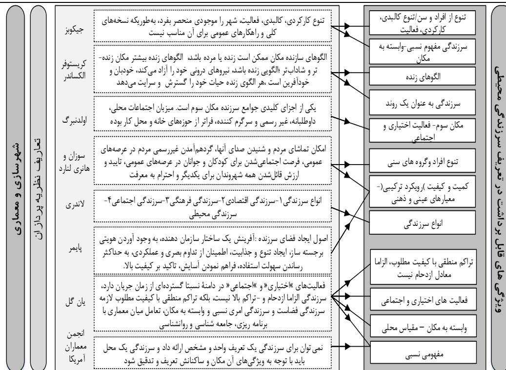
شکل (۴). ویژگی های قابل برداشت تعریف سرزندگی محیطی از نظریات شهرسازان و معماران