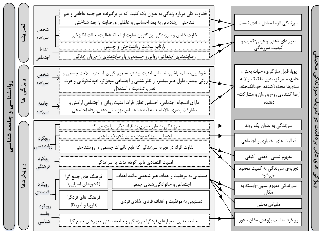
شکل (۳). تطبیق تعاریف حوزه روان‌شناسی و جامع‌شناسی با سرزندگی محیطی