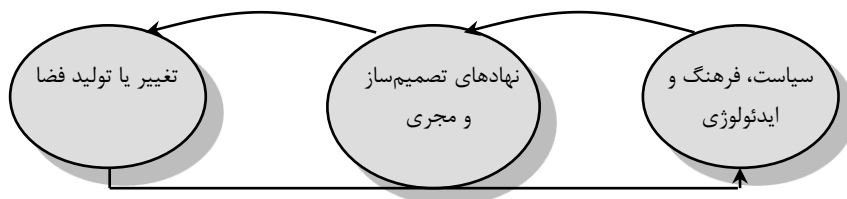
شکل (۱). رابطه سیاست و ایدئولوژی با تغییرات فضایی

در این راستا عناصر و محتوی فضای جغرافیایی در انضمام با نحوه تخصیص منابع و تبیین و چگونگی سیاست‌گذاری آن از سوی قدرت اجتماعی-سیاسی حاکم صورت می‌گیرد. در این راستا جغرافیدانان نسبت‌گرا متأثر از شناخت واقعیت‌های عملکرد سیاست و ایدئولوژی تبیین‌های استقرایی و جزئی را نافع تجویزات و غایت مطالعات اجتماعی ندانسته و در تحلیل فضایی به نقش قدرت در قالب اشکالی همچون گفتمان، ایدئولوژی و اقتصاد سیاسی توجه ویژه‌ای می‌نمایند. در این نگاه پرسش از چیستی گفتمان و سیاست پرسش از مجموعه‌ای از روابط درهم‌تنیده‌ای است که در کار شکل دادن به مناسباتی مرتبط با معنا بخشیدن و شکل دادن به فضای جغرافیایی می‌باشند. در چارچوب امر سیاسی ایدئولوژی، اقتصاد سیاسی و روابط اجتماعی به مدخلی برای شناخت فرم‌ها و فرایندهای فضایی در نظر گرفته می‌شود (تراکمه، ۱۳۹۳: ۲۶)؛ بنابراین هر چند هدف علوم جغرافیایی سازمان‌دهی فضایی در مقیاس‌های مختلف محلی، منطقه‌ای و ملی است. لیکن این سازمان‌دهی بدون لحاظ نمودن اثر هرکدام از سیاست‌های فضایی در ایجاد پراکندگی‌ها و افتراقات مکانی-فضایی ناکامل خواهد بود و فضا محصول نزاع میان «اتوریت‌های رقیب» بر سر دستیابی جهت سازمان‌دهی، اشغال و مدیریت می‌باشد.