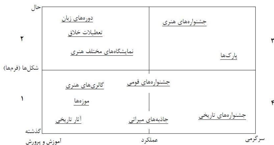
شکل (۱). گونه‌شناسی از جاذبه‌های گردشگری فرهنگی

ارتباط گردشگری و فرهنگ در حال تبدیل شدن به یک امر طبیعی و عادی است. بسیاری از ابعاد گردشگری معاصر عناصر فرهنگی هر جامعه را ارائه می‌دهند. شکل (۱) به لحاظ بصری بازنمایی مفیدی توسط ریچاردز از یک محیط گردشگری فرهنگی را نشان می‌دهد. در این شکل، دو مقیاس - اشکال گذشته / حال و عملکرد / آموزش و پرورش / سرگرمی - را نشان می‌دهند که شامل طیف گسترده‌ای از محصولات فرهنگی تا آنچه که برای گردشگران اجرا می‌شود؛ مانند صحنه جشنواره‌ها و همچنین فرم‌هایی که می‌تواند تقریباً تحرکی برای صنعت گردشگری باشد که نمایشگاه‌های هنری و دوره‌های زبان را در بر می‌گیرد.