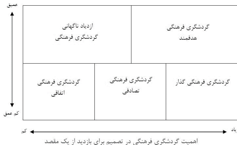
شکل (۳). گردشگری فرهنگی

تولید فرهنگی خواهد شد. شکل (۳). در این مدل، شاخص‌های مورد استفاده، تجربه عمیق و به دنبال آن اهمیت گردشگری فرهنگی در تصمیم برای بازدید از یک مقصد است.