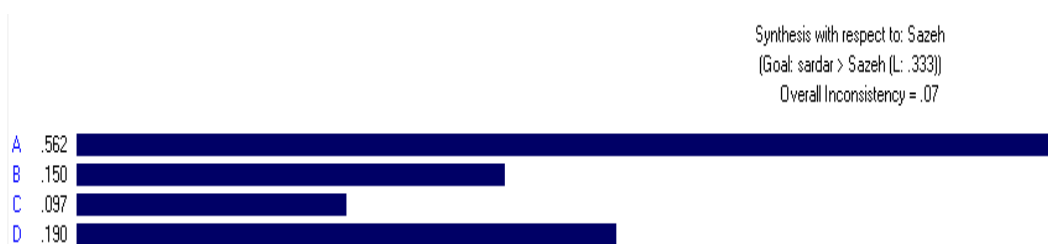
شکل (۳). اولویت‌بندی ویژگی‌های کالبدی سردر بناها (زیرمعیارها) دوره پهلوی در شهر زاهدان

اولویت‌بندی ویژگی‌های تزئینی سردر بناهای دوره پهلوی در شهر زاهدان (زیرمعیارها) اولویت‌بندی ویژگی‌های تزئینی سردر بناهای دوره پهلوی در شهر زاهدان نیز بررسی شد. در این زمینه نیز چهار ویژگی مورد تأکید بوده است که شامل کتیبه آجری ساده، تزئینات (ساده، جناغی، پیچ ماری و رگ چین)، تاجدار ساده با طاق گرد و جناغی و آجرکاری ساده با چین افقی است. تحلیل دیدگاه کارشناسان نشان می‌دهد که ویژگی استفاده از تزئینات ساده، جناغی، پیچ ماری و رگ چین با وزن ۰/۳۷۶ به‌عنوان مهم‌ترین ویژگی یا شاخص تزئینی سردر بناها شناخته شده است. در حقیقت این ویژگی، سردر بناهای دوره پهلوی در شهر زاهدان را متمایز می‌نماید. همچنین استفاده از کتیبه‌های آجری ساده نیز با وزن ۰/۲۴۱ در رتبه دوم اهمیت قرار گرفته است که در بیشتر بناها و سردر بناها قابل‌مشاهده است و نقش مهمی را در تزئینات سردرها ایفا می‌کند. تاجدار بودن ساده با طاق گرد و جناغی با وزن ۰/۲۳۱ در رتبه سوم و آجرکاری ساده با چین افقی نیز با وزن ۰/۱۵۲ در رتبه چهارم این اولویت‌بندی و اهمیت قرار گرفته‌اند؛ بنابراین استفاده از آجر، تاجدار بودن، استفاده از طاق‌های گر و جناغی و همچنین تزئینات غالب با آجر و به‌صورت ساده، غالب ویژگی‌های تزئینی سردر بناهای دوره پهلوی در شهر زاهدان محسوب می‌شود. جدول (۶) و شکل (۴) اولویت‌بندی ویژگی‌های تزئینی سردر بناها (زیرمعیار) دوره پهلوی در شهر زاهدان را با روش AHP نشان می‌دهد.