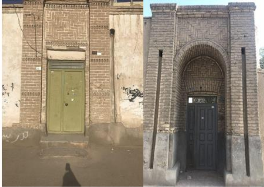
شکل (۱). سردر و تزئینات بنای مسکونی دوره پهلوی در شهر زاهدان (محقق، ۱۴۰۰)