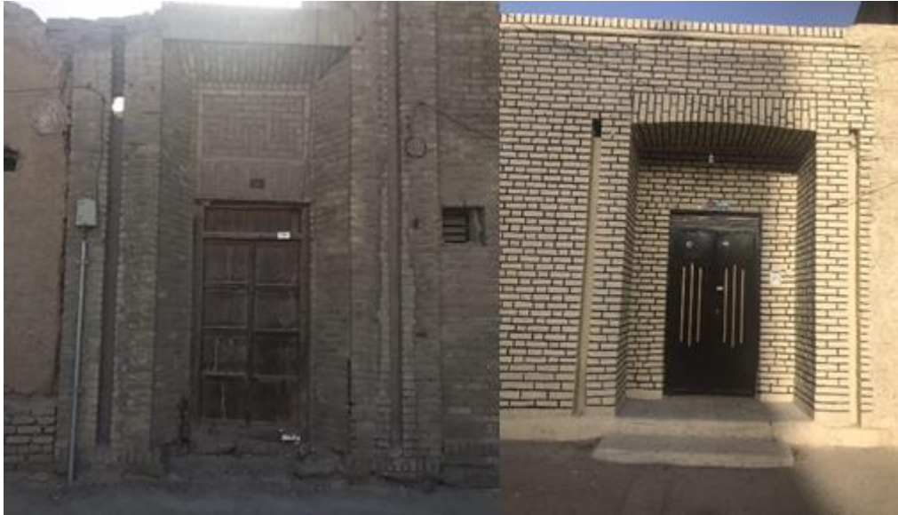
شکل (۲). سردر و تزیینات بنای مسکونی دوره پهلوی در شهر زاهدان (محقق، ۱۴۰۰)