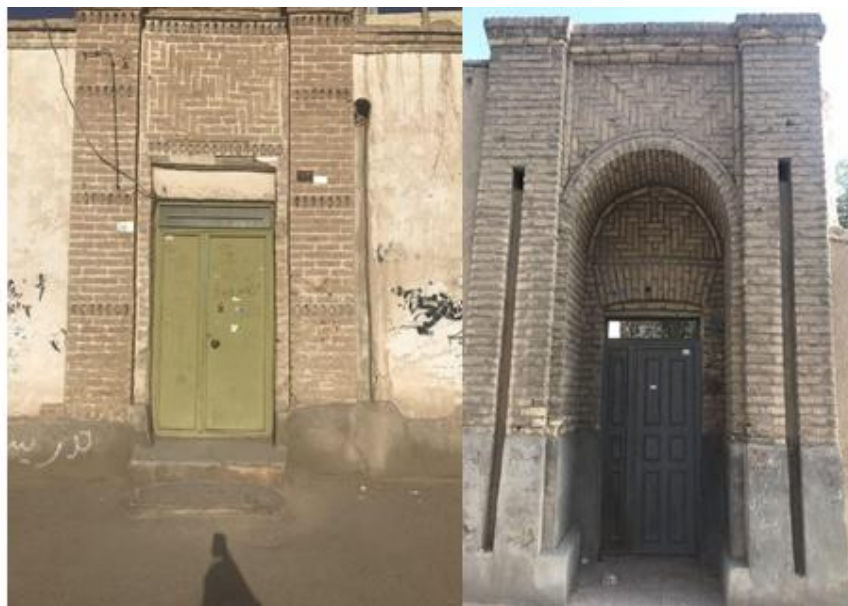
شکل (۱). سردر و تزیینات بنای مسکونی دوره پهلوی در شهر زاهدان (محقق، ۱۴۰۰)