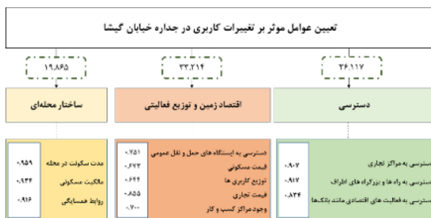
شکل (۲). مدل مفهومی منتج از بررسی مدل تحلیل عاملی در خیابان گیشا