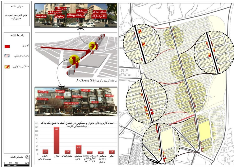
شکل (۳). نقشه توزیع و پراکندگی کاربری‌های تجاری در خیابان گیشا

به اندازه‌ای باشد که حضور ۲۳ بانک را توجیه کند. به منظور مشخص تر شدن وضعیت حضور بانک‌ها و مشاورین املاک در این خیابان، شکل (۵) در تشریح عامل دسترسی به مراکز مهم فعالیت اقتصادی ترسیم شده است.